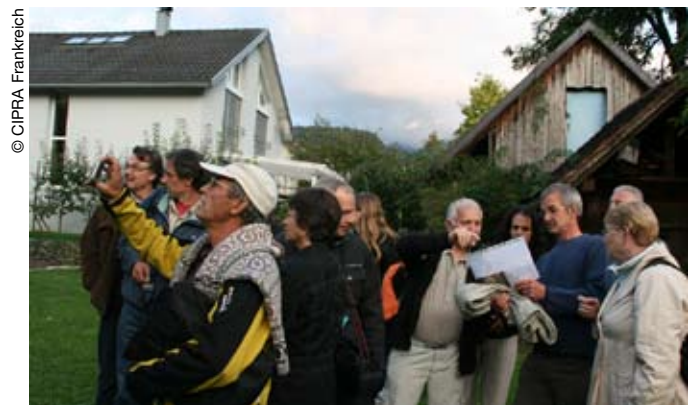
Ein konstruktiver Austausch vor Ort zwischen Referenten und TeilnehmerInnen in Vorarlberg.