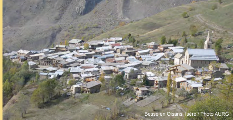
Besse en Oisans, Isère

4. Pays gapençais (Hautes-Alpes) : programme LEADER, une intervention de l'Europe sur le Pays gapençais : entre identité villageoise et maintien de l'agriculture , par Julien Saint Aman, directeur du Pays gapençais.