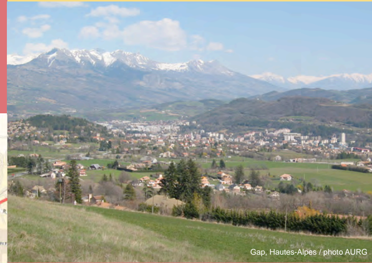
Gap, Hautes-Alpes