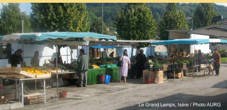
Le Grand Lemps, Isère