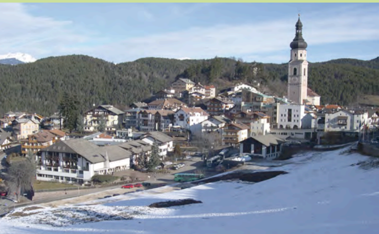
Castelrotto, Italie

La Ville de Gap, le Pays gapençais, l'Agence d'urbanisme de la région grenobloise et le réseau de communes « Alliance dans les Alpes » vous proposent de croiser regards et débats à l'heure de l'élaboration de nouveaux outils et projets dans nos territoires.