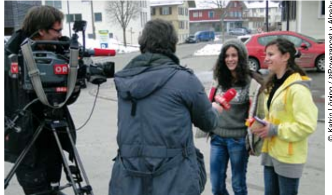
© Katrin Löning / »Povezanost v Alpah«

ORF intervjuja francosko mladino med Kick-off srečanjem v okviru projekta My Clime-mate.