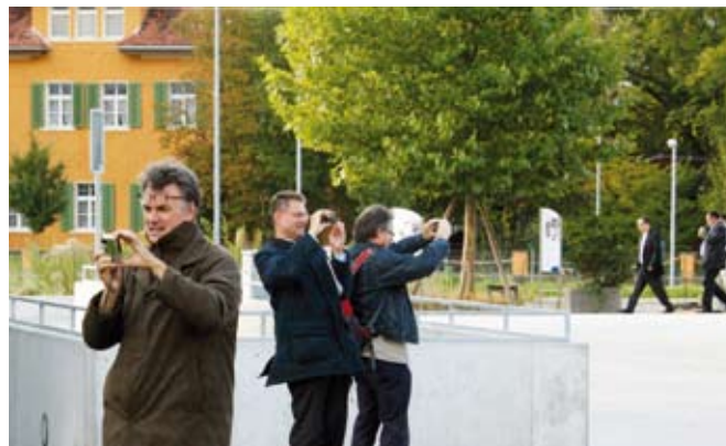
Zavezanost prebivalcev Lihtenštajna skupnemu življenjskemu prostoru je na udeležence vseh ekskurzij naredila izreden vtis.

33 % celotnega območja občine Mauren so gozdne površine. Pritisk na rabo zemljišč je na tem območju zelo velik. Spravilo lesa, lov, varstvo narave in varstvo voda ter izraba prostega časa tukaj trčijo eden ob drugega, zato je potreba