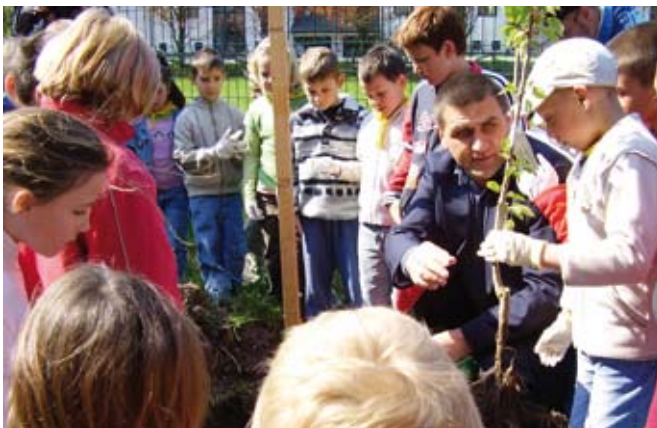
Učenci sadijo drevesa v okviru projekta dynAlp-climate »Povabilo v gozd«.